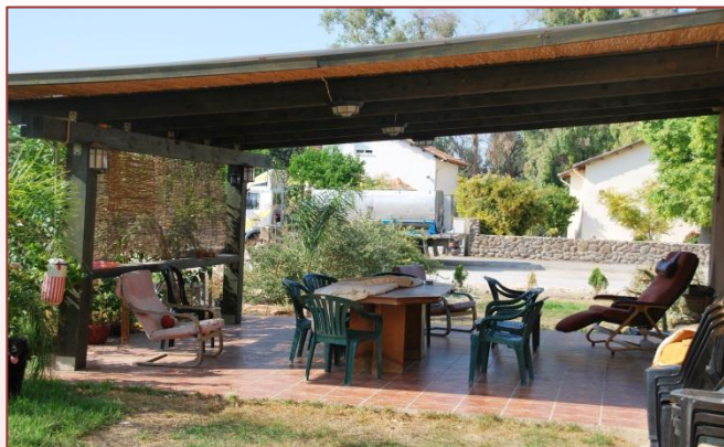
בערב יוצאים לפרגולה

סדר יום: נדב יוצא מוקדם, בין ארבע לחמש וחצי בבוקר. עידית קמה בשש וחצי, מכינה סנדוויצ'ים לילדים ושולחת אותם לבית הספר. זיו נשארת עם אמא לעוד קצת "זמן איכות". עידית עצמאית, קובעת לעצמה את סדר היום.