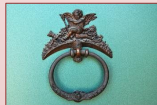
על דלת הכניסה

מה הביא אתכם לכפר רופין? תכננו לבנות בנווה איתן, אבל העניינים לא הסתדרו. בדקו בכמה מקומות כי היה להם ברור שהם רוצים לגור בעמק. "גרנו בקופסת גפרורים עם 3 ילדים והיינו חייבים לבנות". עידית: "יום אחד פגשתי את אורית דורפמן והיא אמרה לי - תבואי לראות את השכונה בכפר רופין!, אמרתי לה: בחיית אורית, אל תגררי אותי עד לכפר רופין... באנו לראות את השטח ותוך 5 דקות החלטנו". חברים שאלו אותם "למי תמכרו"? ענו: אנחנו בונים בית כדי לגור בו ולא כדי למכור אותו. עידית: "אני זוכרת שיחה עם עירית דרוו בקליטה, שבה שאלתי אותה איך אתם מסתדרים עם זה שזה סוף העולם? עירית ענתה: אנחנו תחילתו של העולם".